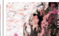
e.artis Online Kunstauktionen

Theaterstraße 58 09111 Chemnitz ☎ 0049/3 71/80 00 78 80 e-artis.de