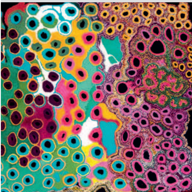
Wie eine mystische Landkarte wirkt das mit Acryl bemalte Leinen von Künstlern des „Spinifex Arts Project“. Die Punkte und Schlieren kennzeichnen Quellen, Pfade oder rituelle Stätten

Die Kunst der australischen Ureinwohner ist reich an Symbolik. Ihre geheimnisvolle Kraft demonstriert nun eine Ausstellung in Freiburg