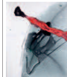
BIG POND ARTWORKS

Kurfürstenstraße 29 80801 München ☎ 0049/89/55 26 73 10 Di.–Fr. 11–19 Uhr, Sa. 10–14 Uhr, big-pond.de